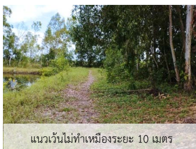
แนวเวนไม่ทำเหมืองระยะ 10 เมตร