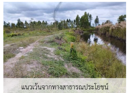
แนวเวนจากทางสาธารณประโยชน์